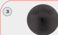
VÁLVULA DE EXHALACIÓN VS04 25 por empaque