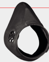
COPA NASAL 1 por empaque