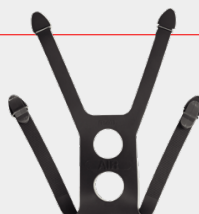
ARNÉS 1 por empaque