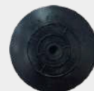
VÁLVULAS MAXFLOW 25 por empaque