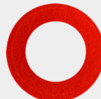
RING PEQUEÑO 20 por empaque