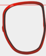
SOPORTE PLÁSTICO 1 por empaque