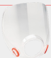
VISOR TRANSPARENTE 1 por empaque