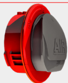
TAPA FRONTAL 1 por empaque